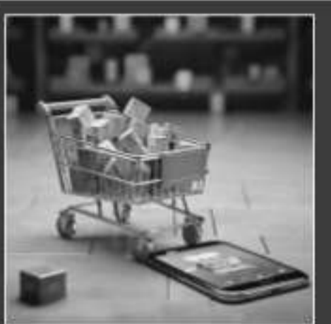
■ Counterpoint Research data shows that Samsung and Xiaomi together held an almost 33% share of the Indian market in 2024

control over goods they list online. Local laws prohibit foreign e-commerce companies from doing so as the platforms can only operate a marketplace to connect buyers and sellers.